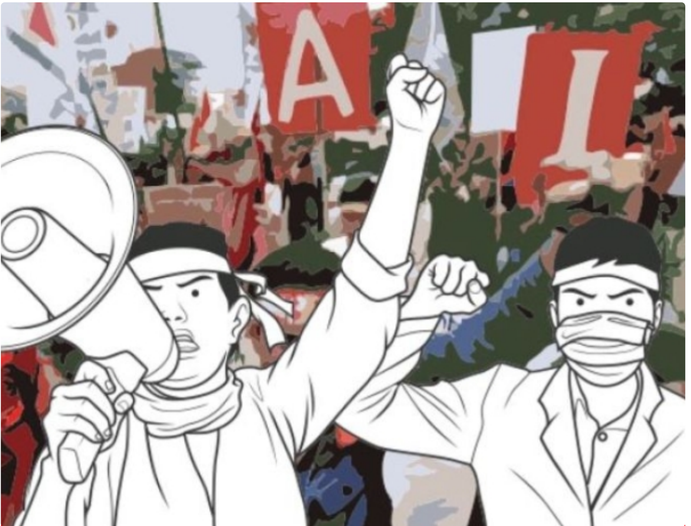
Ilustrasi Gambar Demo Masyarakat

PALANGKA RAYA - Paska divonis bebasnya bandar besar Narkoba, Salihin Bin Abdulah alias Saleh beberapa waktu oleh Majelis Hakim Negeri Pengadilan (PN) Palangka Raya, menuai kontroversi dan kecamatan masyarakat, khusus kota Palangka Raya.